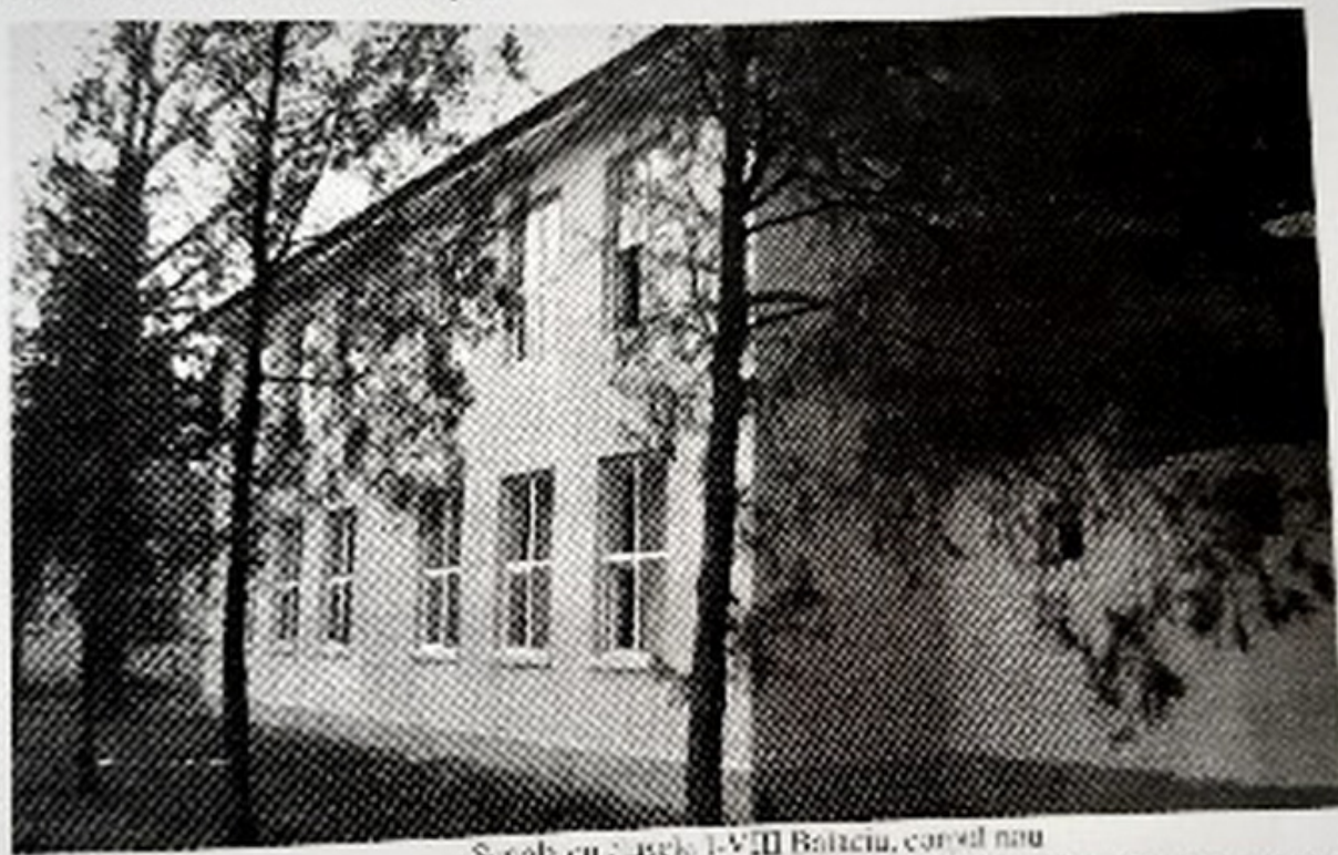
Școală cu clasele I-VIII Balaciu, corșil nou