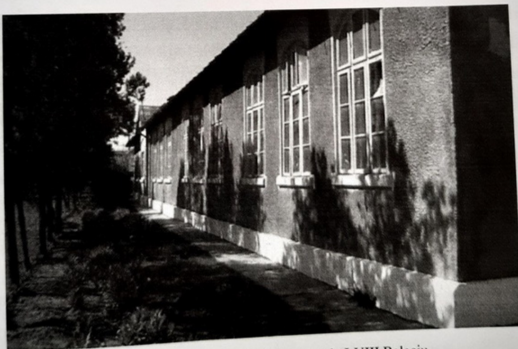
Sectia Crasani a Scolii cu clasele I-VIII Balaciu