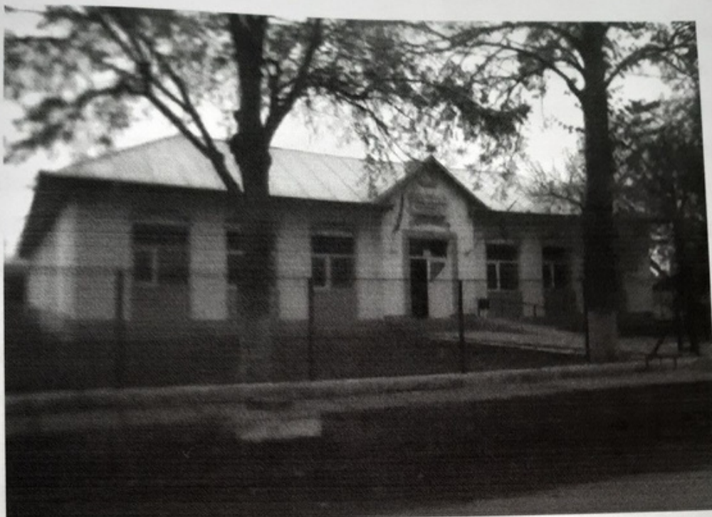
Sectia Sarateni a Scolii cu clasele I-VIII Balaciu